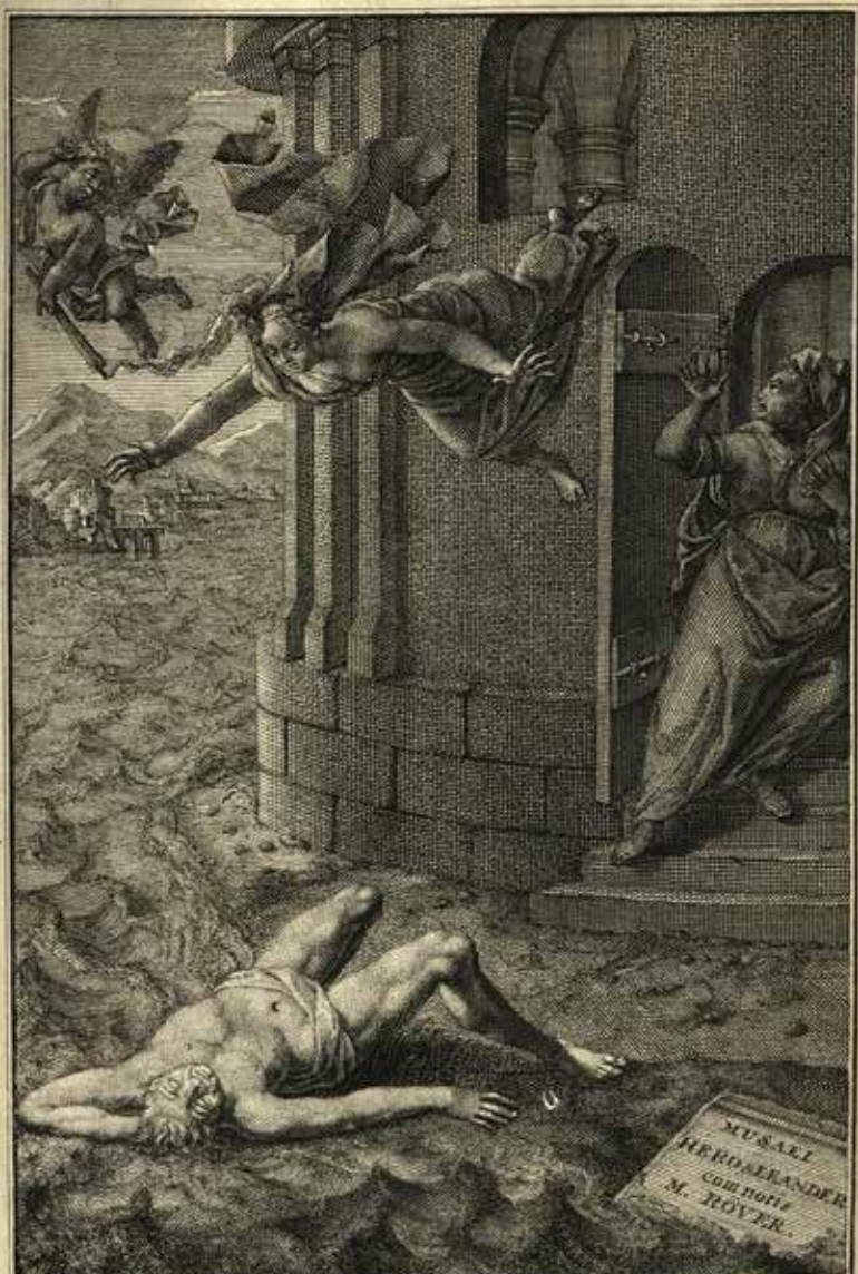
LUGDUNI BATAVORUM, Apud THEODORUM HAAK.

F. v. d. Meer, del. J. v. d. Meer, fecit.