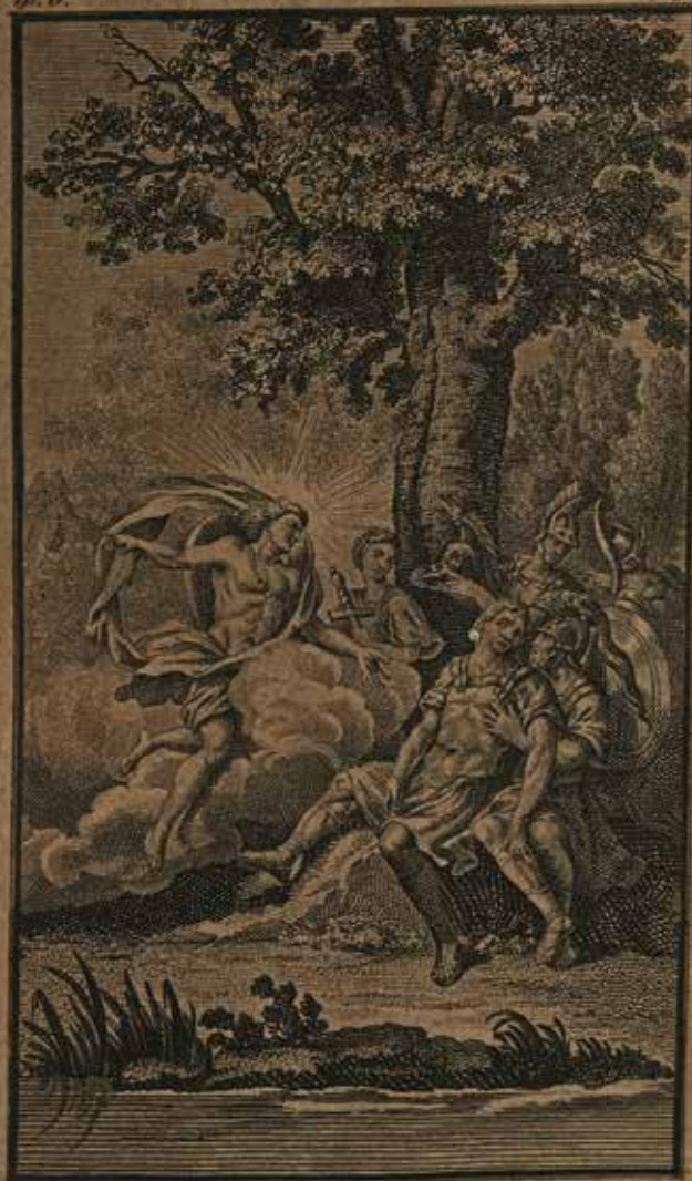
Θάλασσα, Ἐπίωρ μέγαρ βενδόν ἐκ κοροπιῶν Ἰνός Ἰόνος Προβιάμη δ' ὁ κρῆταρος ἢ μύριδος κροιδύς.